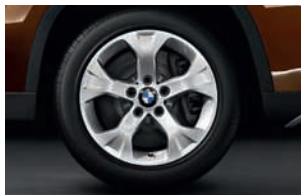
Original BMW Winter Komplettad-satz für BMW X1 E84

Aktionspreis..... 640,- Zzgl. Montage und Blenden