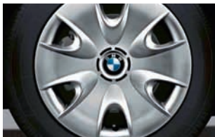
Original BMW Winter Komplettad-satz für BMW 3er ab Bj. 2004