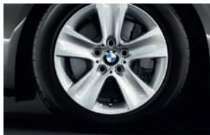
Original BMW Winter Komplettad-satz für BMW 5er F10/F11 ab 2010